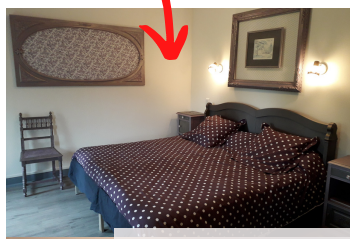
2 chambres (après)