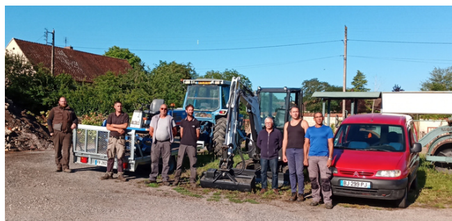
La municipalité vient d'acquérir une pelleteuse (l'acquisition a été subventionnée par le fonds de concours de la Communauté de Communes), ainsi qu'un Berlingot Citroën qui remplace l'ancienne ZX.

Voilà ce qui, j'espère, vous aura livré un rapide tour d'horizon. Les journées « Ville Ouverte » nous ont permis d'acter nos axes de travail pour « Bellenaves demain ». Le chantier est vaste ! Vous êtes intéressé ? Vous souhaitez participer ? La porte est ouverte ! Loin d'être une « direction d'en haut » dite « jupitérienne » pour reprendre un qualificatif actuel, nous souhaitons que chacun puisse s'exprimer.