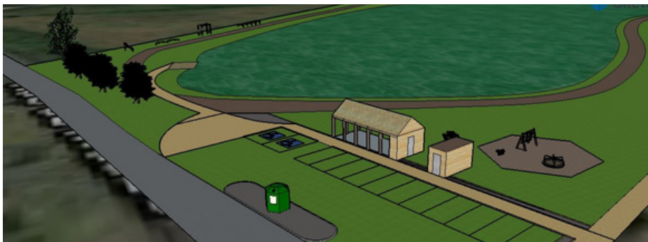
Esquisse du projet d'aménagement.

Ce projet à l'étude permettrait aux Bellenavois.es de se retrouver en famille ou entre amis dans le cadre agréable de notre étang.